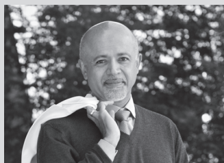
Abraham Verghese Καθηγητής Ιατρικής Stanford University